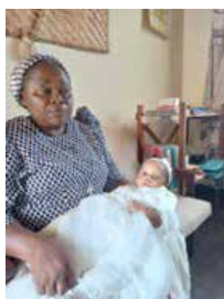
Baby uit NTAMBE