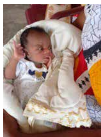
Baby en kindje van 2 jaar uit MALOLE