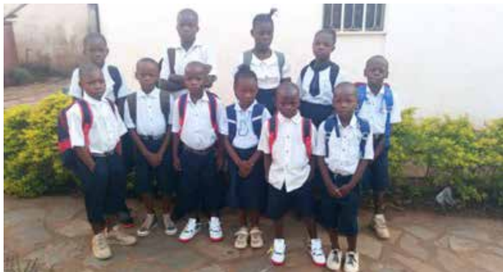
De kinderen van een van de schoolklassen die klaar staan om te beginnen

Sedert 10 september 2022 zijn de leerplichtige kinderen weer met succes naar school gegaan. De weeskinderen van de communauteiten van Mashala en Lusambo zijn kende door de cholera epidemie een slechte start. Hun school bleef gesloten.