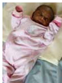
Baby uit KANANGA

Beste weldoeners wij merken dat de Heer ons heeft bijgestaan in dit kleine seizoen. Onze velden in MULAMBA hebben ons vijf fusten maïs opgeleverd. Twee fusten maïs hebben we aan de weeskinderen en armen gegeven. De andere 3 fusten zijn verkocht om middelen te kopen om het veld van 5 ha in te zaaien voor het nieuwe seizoen. Deze velden zijn inmiddels opnieuw ingezaaid. Wij hopen op een goede opbrengst.