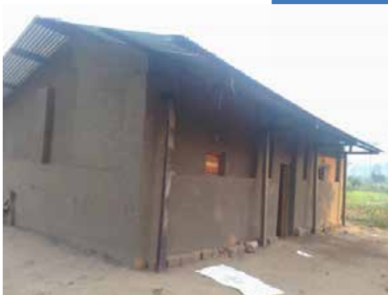
Vernieuwing is bijna gereed

In mei dit jaar hebben wij een grote ramp gehad die onze congregatie deed schudden. Binnen één maand heeft een massale sterfte plaats gevonden onder onze koeien. Begonnen we dit jaar met 62 beesten, in mei gingen er één voor één koeien dood totdat de teller stopte op 32. Het verantwoordelijke team was niet in staat deze ramp te stoppen. De, tot op heden, onbeantwoorde vragen luidde: wat is de oorzaak? Is het een epidemie of hebben zij onkruid gegeten? Of ...? Wij hopen dat onze medezusters die er zich mee bezig houden de ware oorzaak zullen vinden en het probleem kunnen oplossen. Momenteel is de situatie stabiel, maar hebben we helaas nog maar 30 koeien.