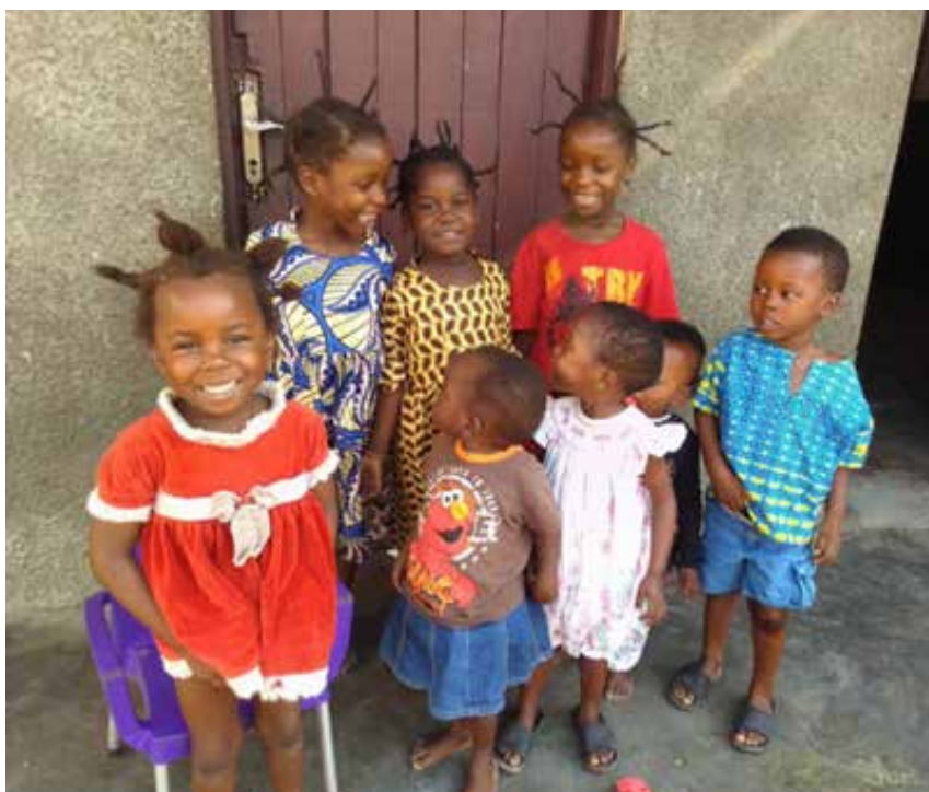
Blijge gezichten voor het vernieuwe weeshuis in Kakenge

Ondanks dit droevige nieuws blijven wij ons best doen voor onze weeskinderen en armen.