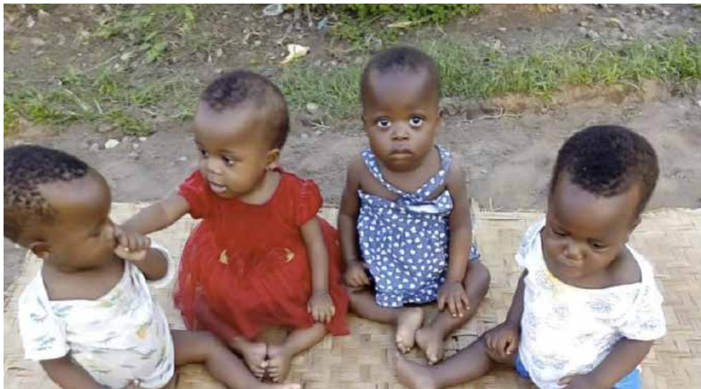
De kinderen uit AZDA

Dit is een grote communiteit met 25 interne kinderen en 10 zijn in een gezin ondergebracht. Zij komen een keer per maand bij de zusters en krijgen zeep en noodzakelijke dingen mee voor school. Het is een communiteit die veel opbrengt omdat de velden op een juiste manier worden bewerkt.