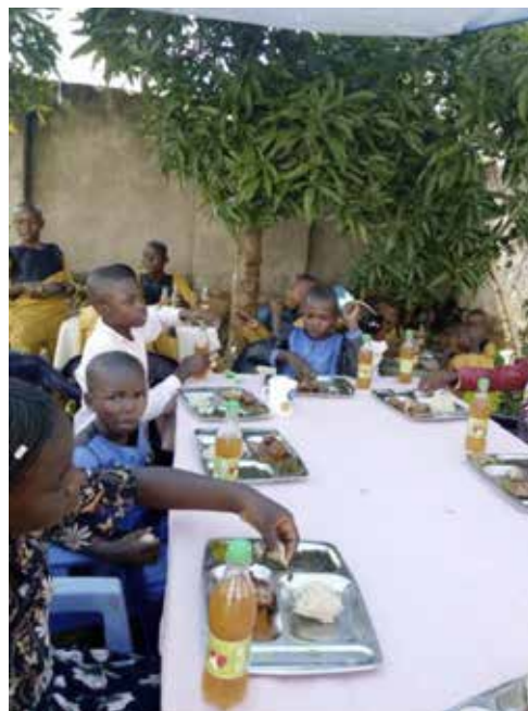
De kinderen uit MBUJI-MAYI

Kent u iemand die geïnteresseerd is om donateur te worden? Meld het ons op info@hwg-afrika.nl dan sturen wij een nieuwsbrief