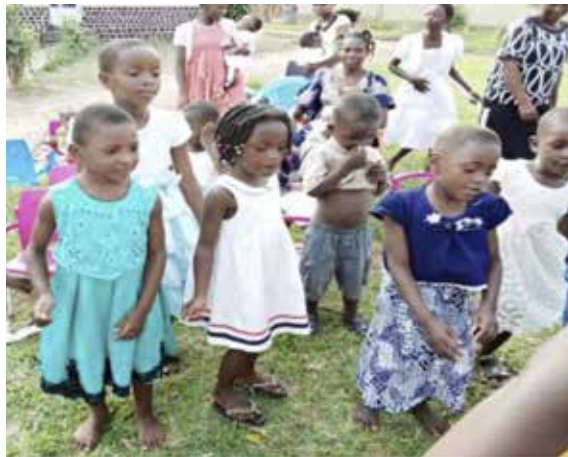
De kinderen uit KANANGA II

Dit weeshuis heeft 40 kinderen van 0 tot 19 jaar. Vanaf november heeft Kananga 2 baby's opgenomen waarvan de moeder is overleden bij de bevalling. Het Kerstfeest is goed verlopen voor de kinderen, de armen en de zusters.